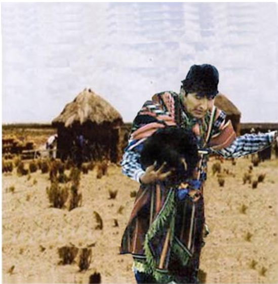
El MAS. de ayer