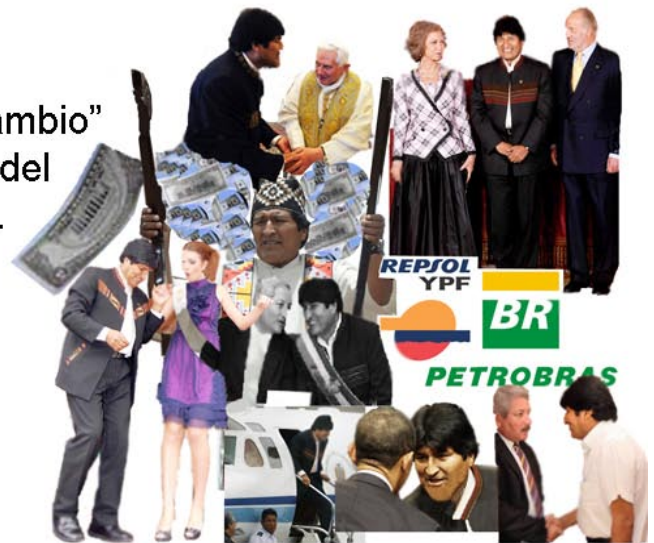
El MAS. de hoy